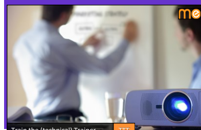
Train the (technical) Trainer TTT

Auch als firmeninternes Training buchbar