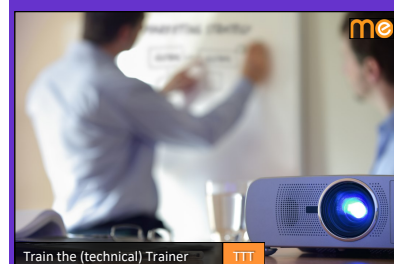
Train the (technical) Trainer TTT

Auch als firmeninternes Inhouse-Training buchbar